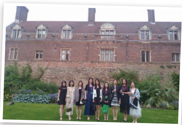
▲ 学生参加 2019 年 CBL International Oxbridge Programmes 并到剑桥大学及牛津大学上课。

另外，大学也鼓励同学在暑假期间参加国外大学的各种暑期项目，用以开阔视野和提升语言能力。