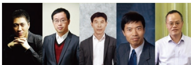
▲ 2018 年度全球高被引科学家：李志武教授、周孟初教授、李颂孝特聘教授、周勇特聘教授以及王俊教授。

入选全球高被引科学家的论文在其相关学科领域内被全球引用最多的前 1%，显示其持续性的重大贡献及影响力，并获全球学界认同与肯定。澳科大五位科学家入选，为澳门最多，且他们均已连续多年上榜。